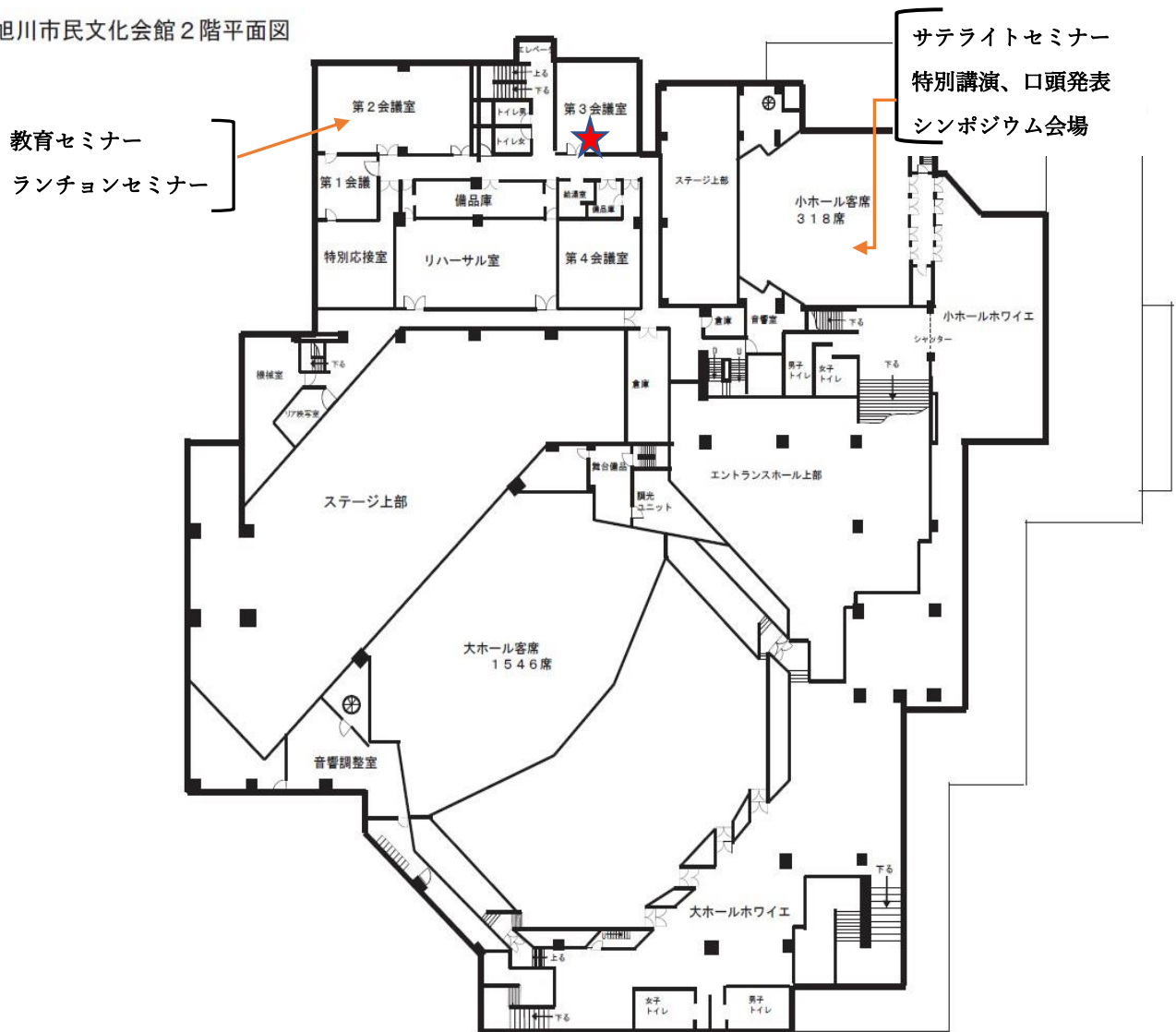
旭川市民文化会館 2階平面図