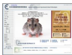
実験動物技術者協会