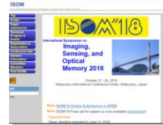
光メモリ・画像・計測 国際シンポジウム