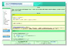
公私立大学実験動物施設協議会