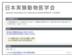
日本実験動物医学会