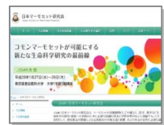
日本マーモセット研究会