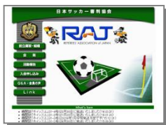
日本サッカー審判協会