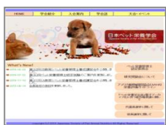
日本ペット栄養学会